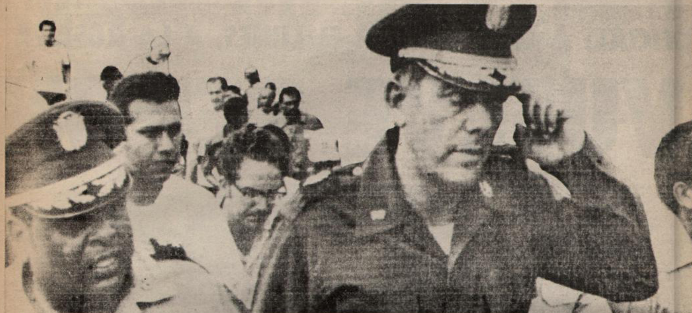
Los norteamericanos dicen que la construcción del Canal y el viaje a la luna son proezas y que la humanidad debe agradecerlas. Pero lo cierto es que a la luna fueron y regresaron y aquí se quedaron.

"La historia del Canal de Panamá es la historia del vasallaje norteamericano", dijo a Noticias el caudillo