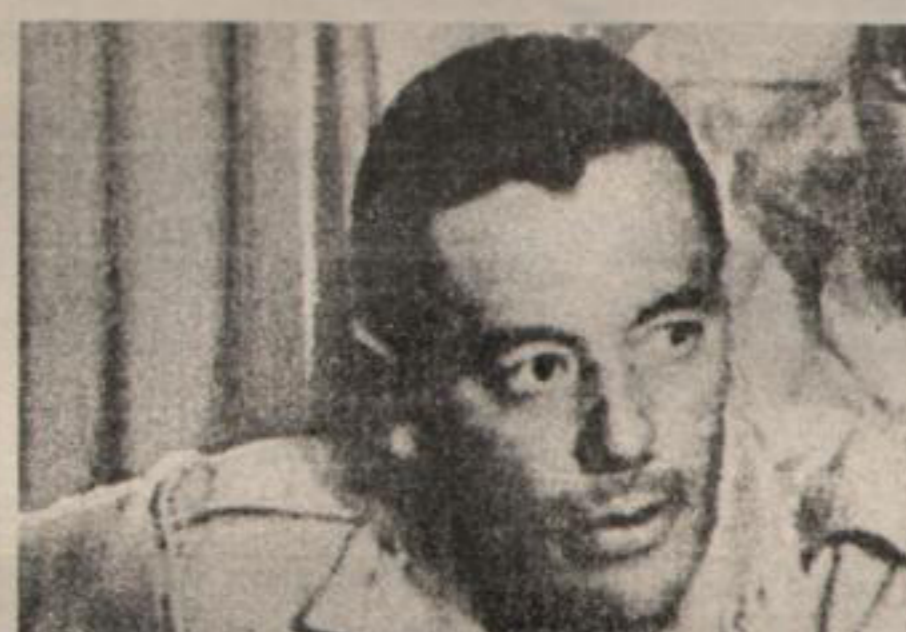
Torrijos pasa cinco días de la semana recorriendo el país.

En la entrevista, hecha por partes, cuando las circunstancias lo permitían, afloró la principal preocupación del general: el problema del canal.