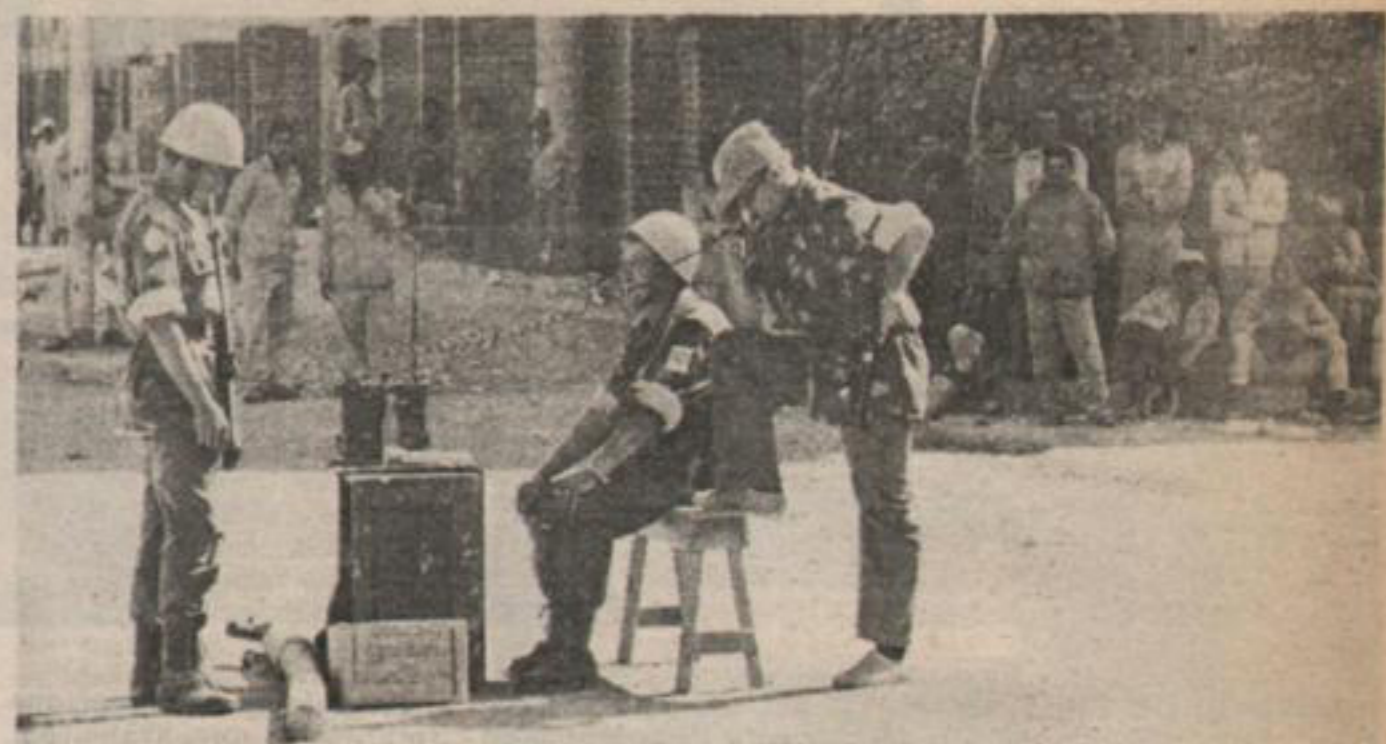
Un oficial de las Naciones Unidas se comunica con su unidad desde el desierto de Suez. Km. 101.

La posición árabe sobre temas de fondo será fijada en la cumbre de Argel, a la que no concurrirán ni Libia ni Irak. Por su parte Kissinger advirtió públicamente a la Unión Soviética sobre las consecuencias de un posible envío de misiles nucleares rusos a Egipto. "Ello sería un asunto muy grave y configuraría un viraje fundamental en la práctica tradicional", señaló el secretario de estado norteamericano. Egipto ha desmentido que esos envíos se hayan producido.