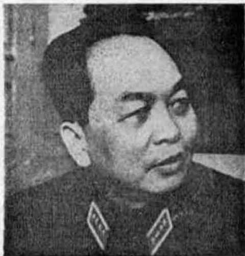
General Vo NGUYEN GIAP.