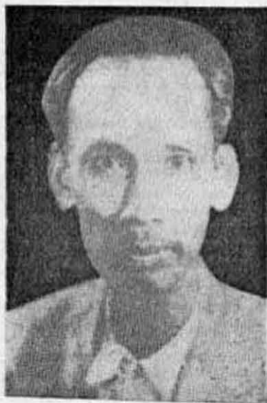
HO CHI MINH (1940)