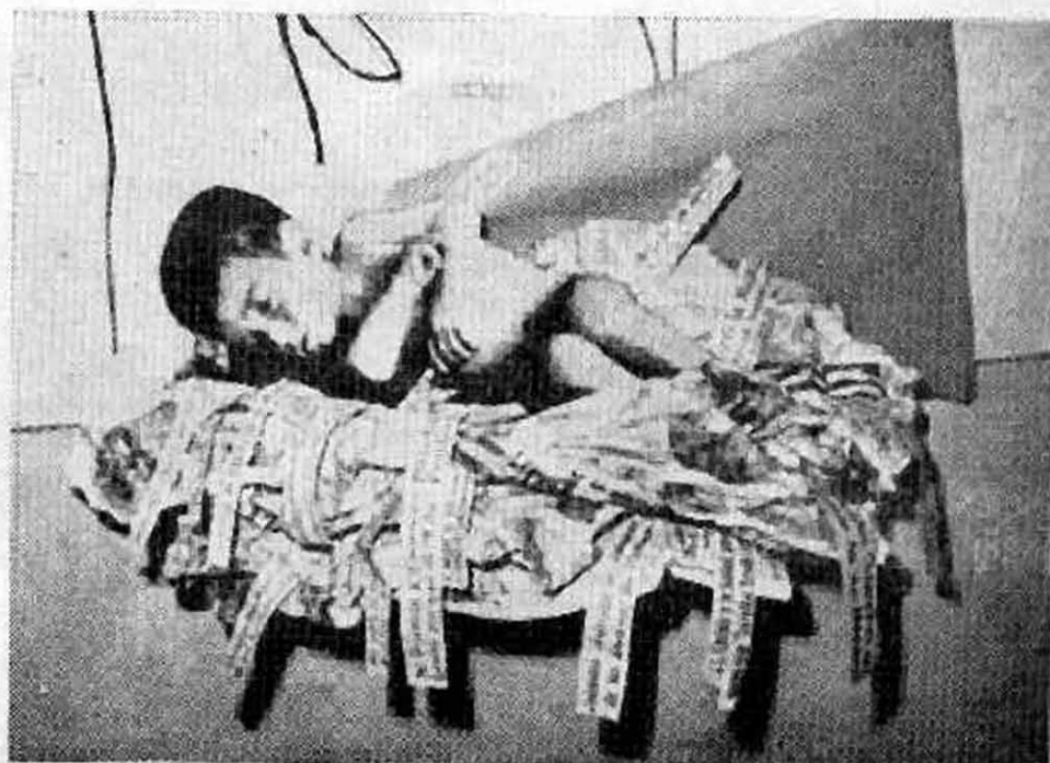
Detalle del pesebre de Navidad, Parroquia los Plátanos.

Estamos cansados de escuchar palabras de paz, justicia, amor, que no pasan de ser palabras y posiciones confusas y en definitiva conciliadoras. Nuestro compromiso es hacer real la paz, la justicia y el amor. Como cristianos, sólo lo entendemos posible al lado de los pobres que luchan por liberarse de toda explotación. "Nadie puede servir a dos señores: o Dios o el dinero".