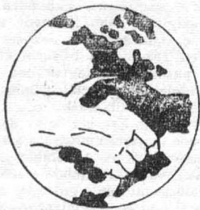
Emblema del SNCC: dos manos enlazadas sin odio sobre América.

Se los ha tratado de hacer lucir como adalides de la venganza infectados del virus comunista, etc. Aparentemente tienen todo en contra. Y como hace casi 20 siglos salen a la luz del día no a pervertir sino a sembrar, no a destruir sino a crear lo que no tienen, no para someterse sino para rebelarse y aun más, para hacer una Revolución, para convertir en vida la justicia. Se equivocan, se rectifican, caen y se levantan. Sobre la marcha van aprendiendo y enseñando lo que jamás nadie les proporcionó, pero que en el hondo latir de las vísceras ruge clamando por algo que no tiene fronteras, colores o nomenclaturas. Algo que llegará al fin como el futuro, por la prepotencia del trabajo. La pantera negra es la imagen de un espíritu que en la hora de los pueblos sojuzgados habla un idioma por momentos amargo, pero siempre noble. El idioma de los que alzan su voz y su fuerza ante los que no les dejan ser humanos, ante los que por amor entienden retórica eficiente. Poder Negro significa esperanza y una razón para vivir. Unidad y organización son su combustible. De abajo hacia arriba, como la semilla en el surco, como la vertiente en el desierto.