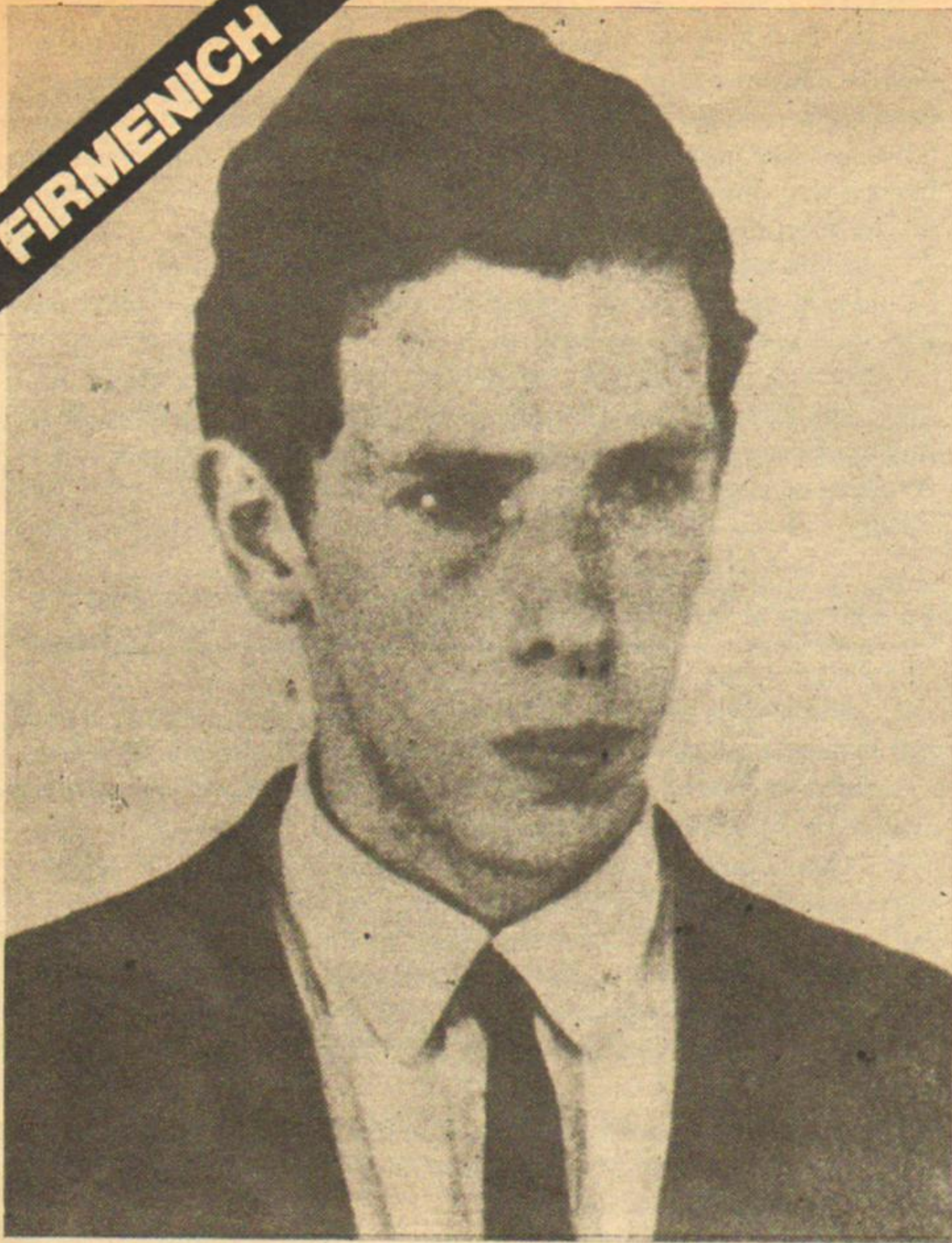
Fernando Abal Medina: la asunción concreta de la lucha armada marcó la primer diferencia con Mugica.