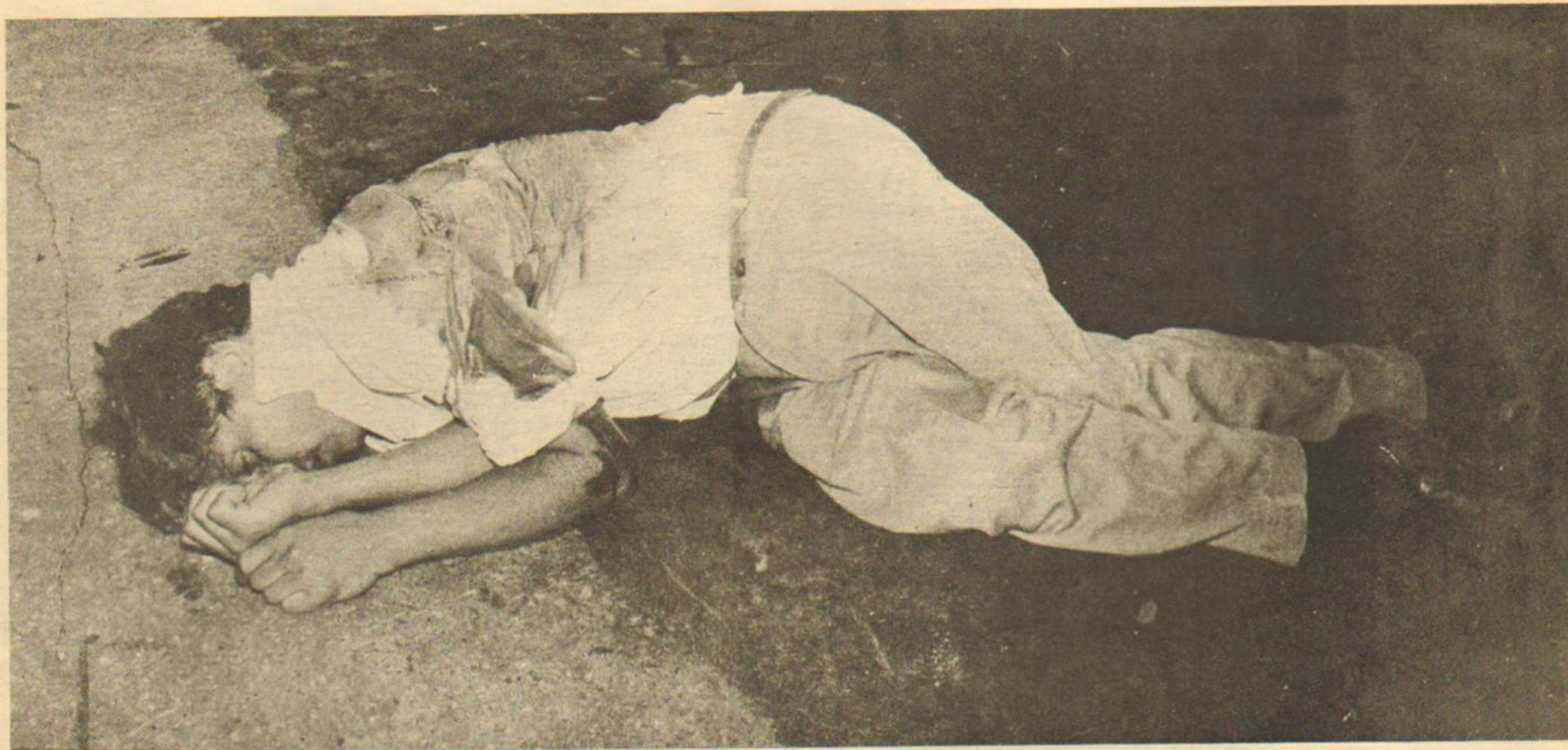
Su último acto político público fue la misa por Chejolán.

Ahora, en el momento de la reflexión, es preciso rectificar los errores y construir la unidad del pueblo.