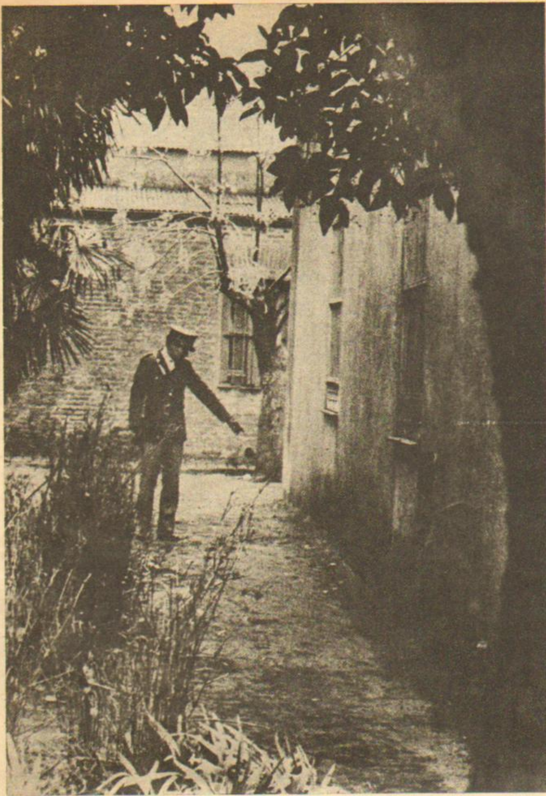
Aquí, en Timote, el pueblo aplicó su justicia.

oligarquía, y cuanto más débil sea la política interior, más rápida y segura será nuestra derrota.