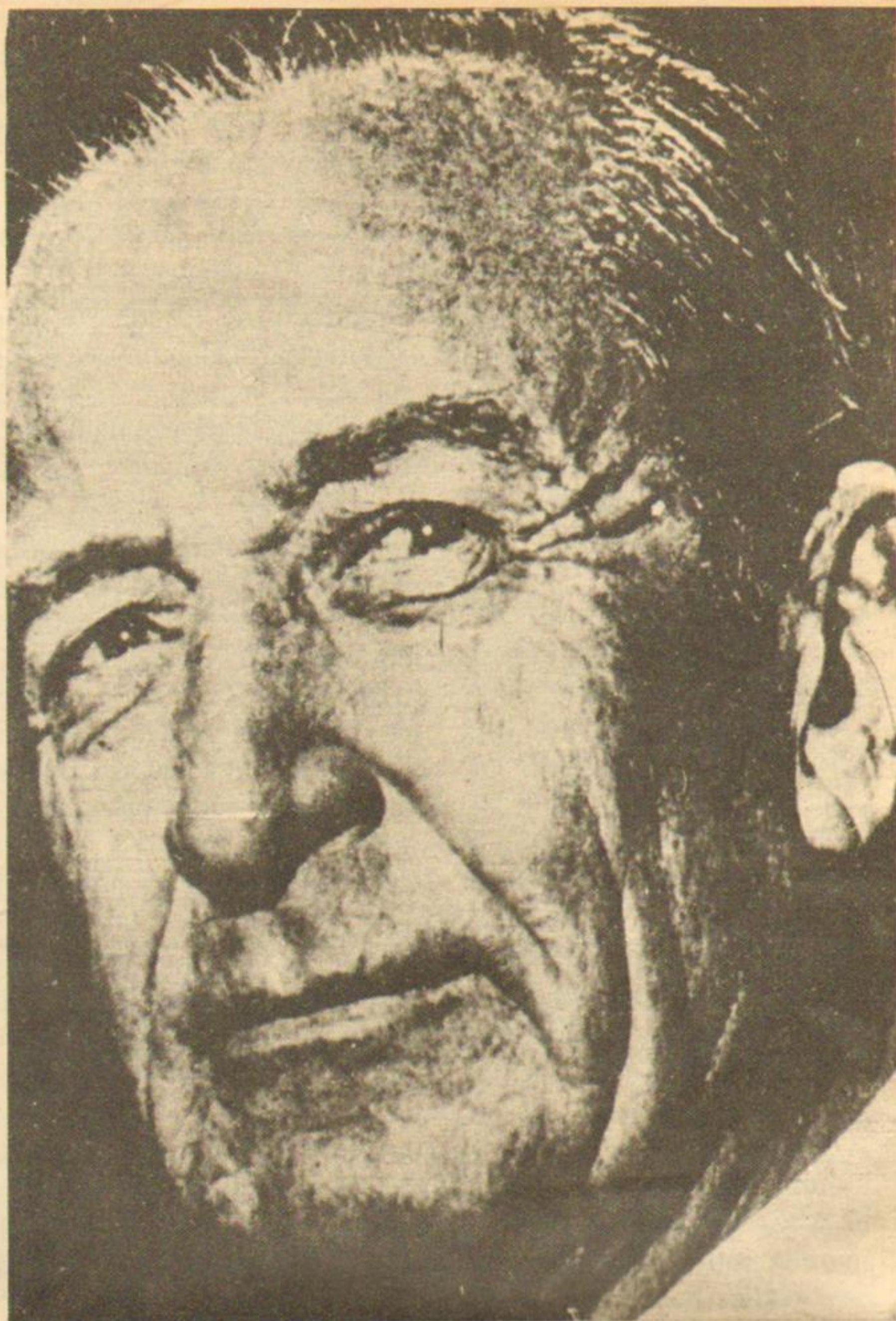
Mugica se jugó defendiendo a los Montoneros después del aramburazo.

"(...) Son los compañeros que alzaron la vista y comprendieron el 1º de mayo que la conducción estratégica del Movimiento era sólo Perón y que el proyecto Montonero era una aventura alucinante de quienes reventaron a Mugica y luego, al más puro estilo gangsteril le enviaron una corona. Como queriendo confundir y engañar."