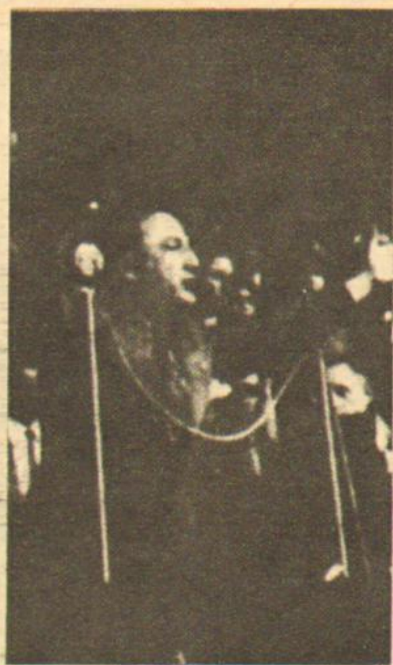
Haya de la Torre cuando era un líder popular (setiembre de 1933, en el mitin de Acho).

no, no ceñido a la política de las grandes potencias, dieron gran importancia a la participación popular, enfrentaron con energía al imperialismo, y realizaron una profunda reforma agraria abriendo paso a formas socialistas y comunitarias de explotación de la tierra.