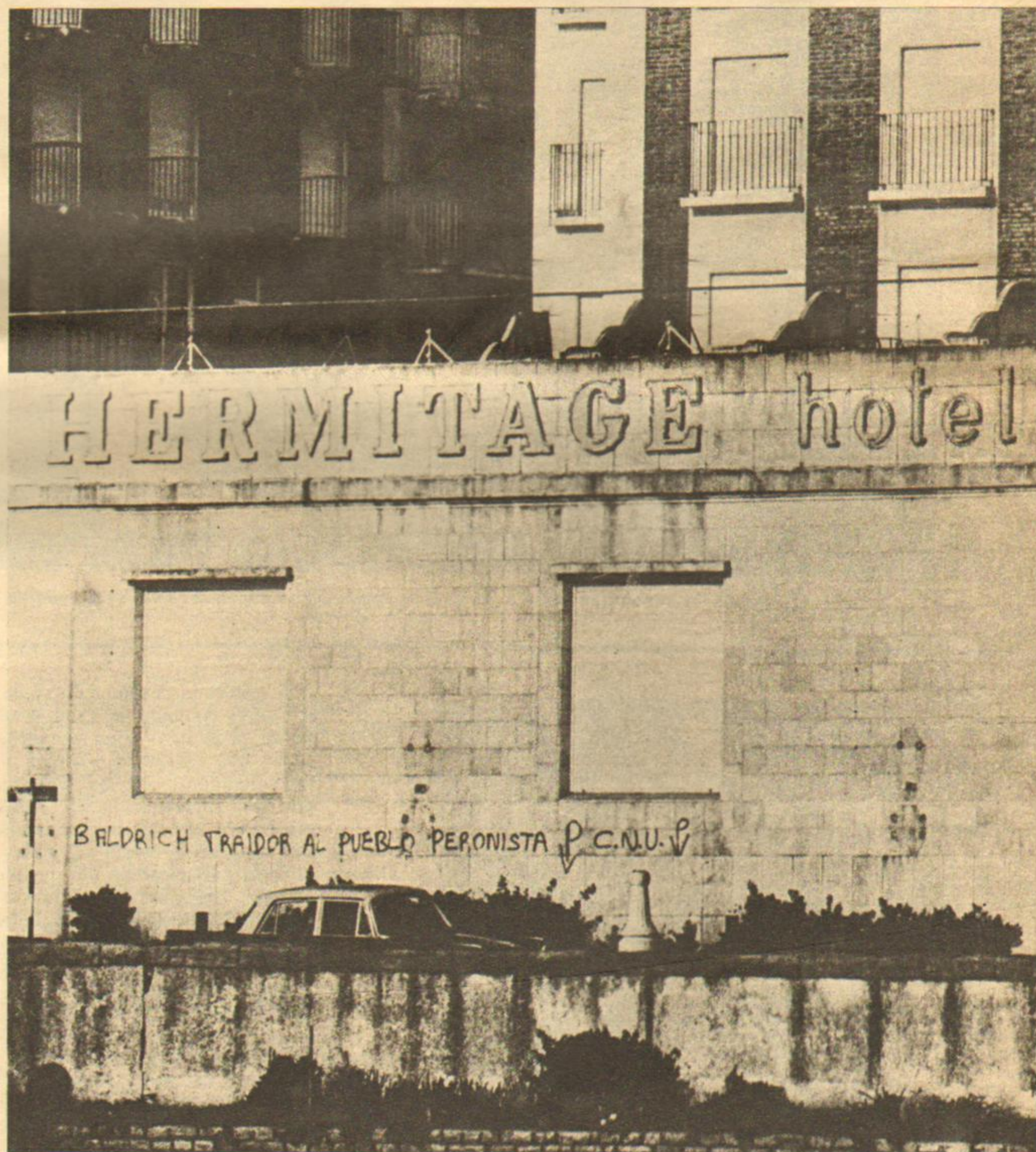
El Hermitage, un bacán marplatense que también sirve de mural a las huestes del CNU. Los discípulos de Giovenco están enojados.

¿En qué negocio andarán los burócratas de la CGT marplatense? Mientras tanto, la ciudad feliz está bajo la protección del CNU, Alianza y Comando de Organización.