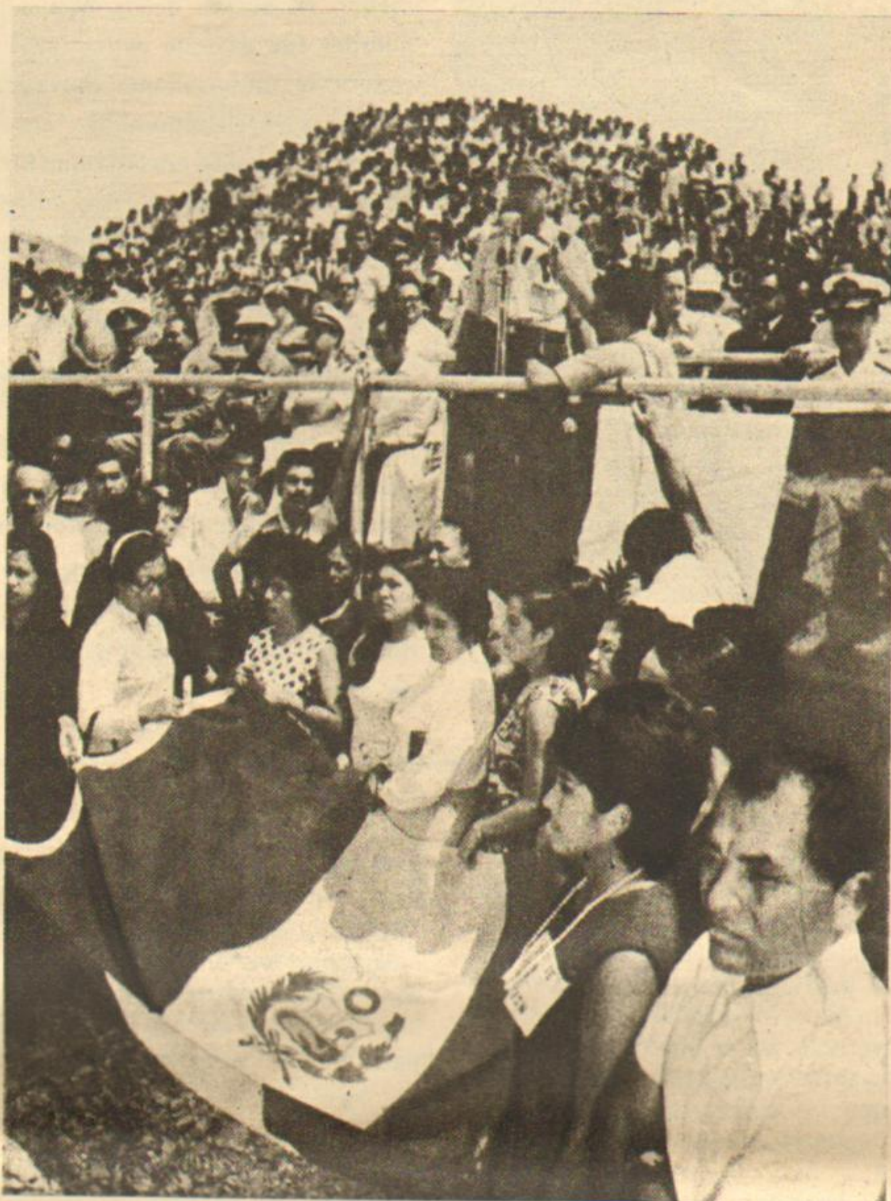
Militares dialogando con su pueblo, sin vergüenza, sin custodias, sin intermediarios ni paternalismos esterilizantes.

obreros en forma permanente, está obligado a compartir la dirección de la empresa y de las utilidades con sus trabajadores, pero al mismo tiempo se asegura que su aporte al proceso de cambios y un lugar en el camino hacia la sociedad socialista.