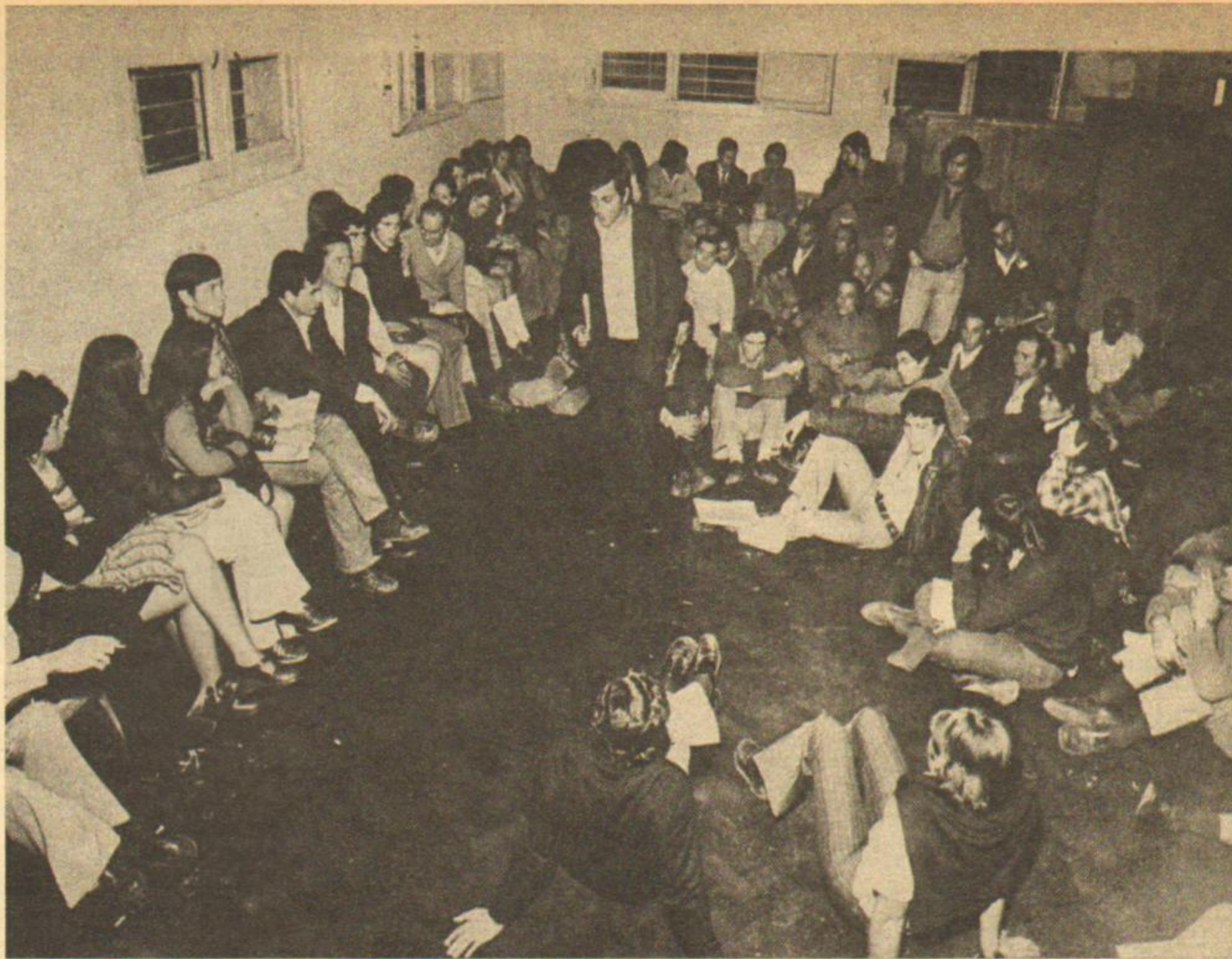
Asamblea del sábado 17: "Hasta que no estén todos en libertad, nadie entra a la fábrica."

La empresa denuncia la medida de fuerza. La delegación