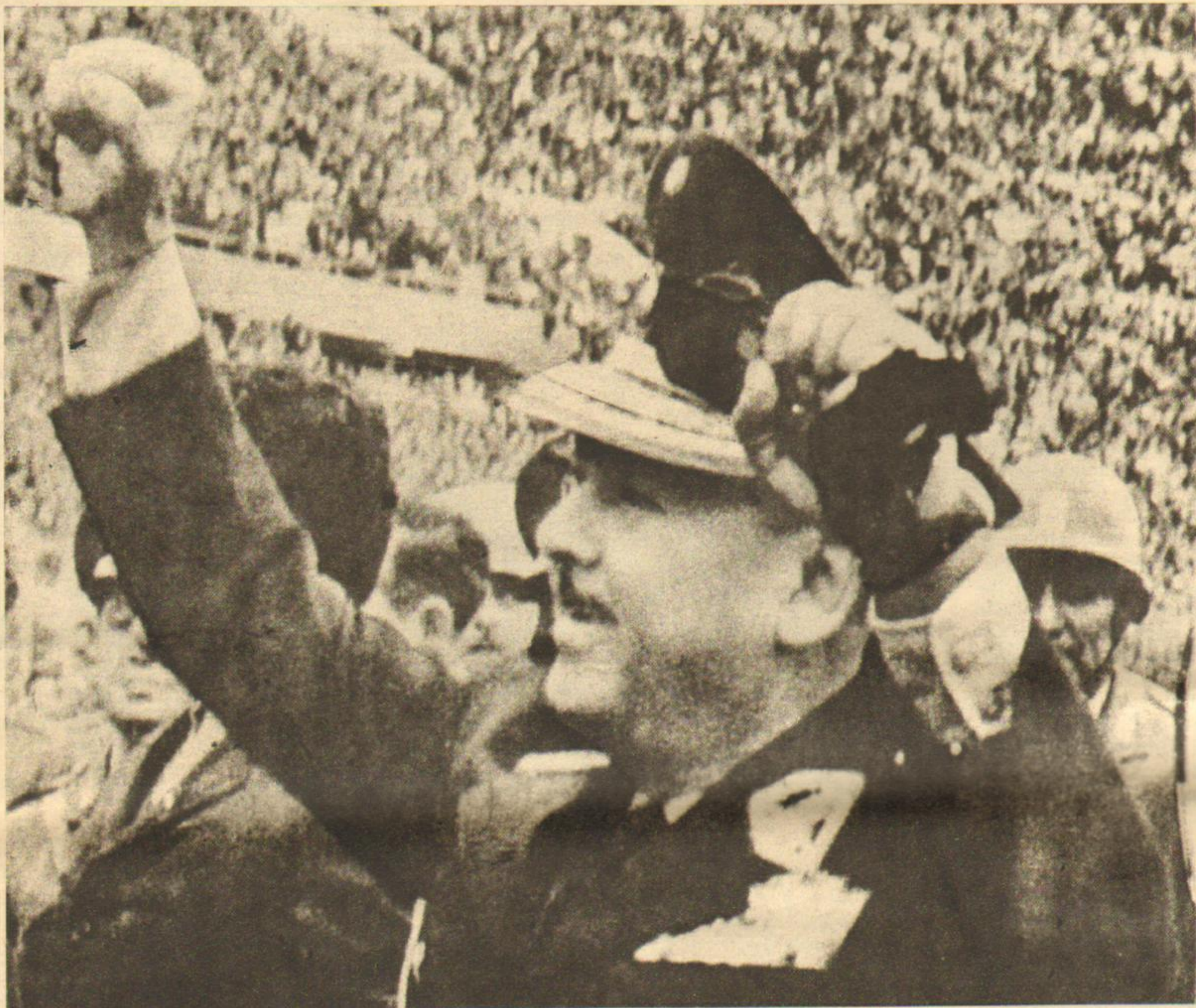
El jefe de la revolución saluda al pueblo como siglos atrás lo hiciera el rebelde Tupac Amará.