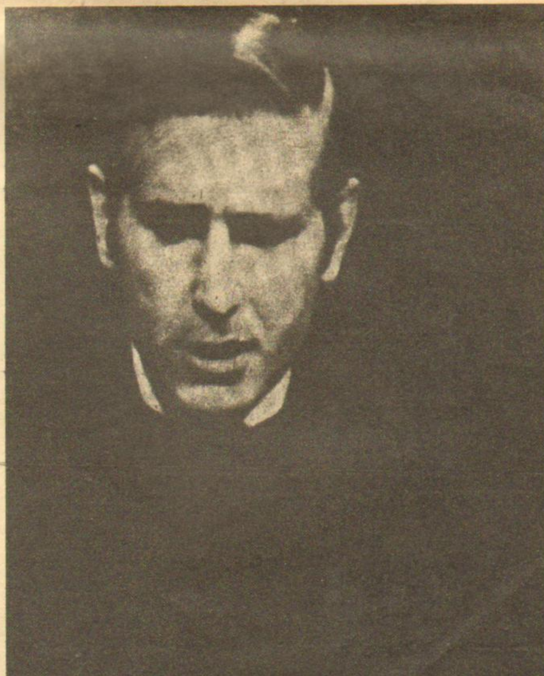
Lo mataron para dividir al Pueblo.

Como puede apreciarse fácilmente, estos dos problemas se relacionan entre sí y, en el fondo son un mismo problema. Su profunda fe cristiana y su profunda comprensión de esa fe lo llevaban inmediatamente al planteo de comprometer su vida en la liberación de los oprimidos. A partir de este planteo, su lucidez lo llevaba a la necesidad de que ese compromiso fuera político; pero nunca se decidió a convertirse en un hombre político, sino que prefirió ser un hombre de iglesia, un sacerdote, que como hombre tenía una definición política, pero no una práctica política. A menudo esta actitud lo llevaba a realizar actos de político, que le significaban roces con las autoridades eclesásticas y le generaban el odio de los oligarcas y los reaccionarios. En tanto su decisión era ser hombre de iglesia, debía limitar sus actos de político, lo que también podía entenderse como una limitación de su propio compromiso.