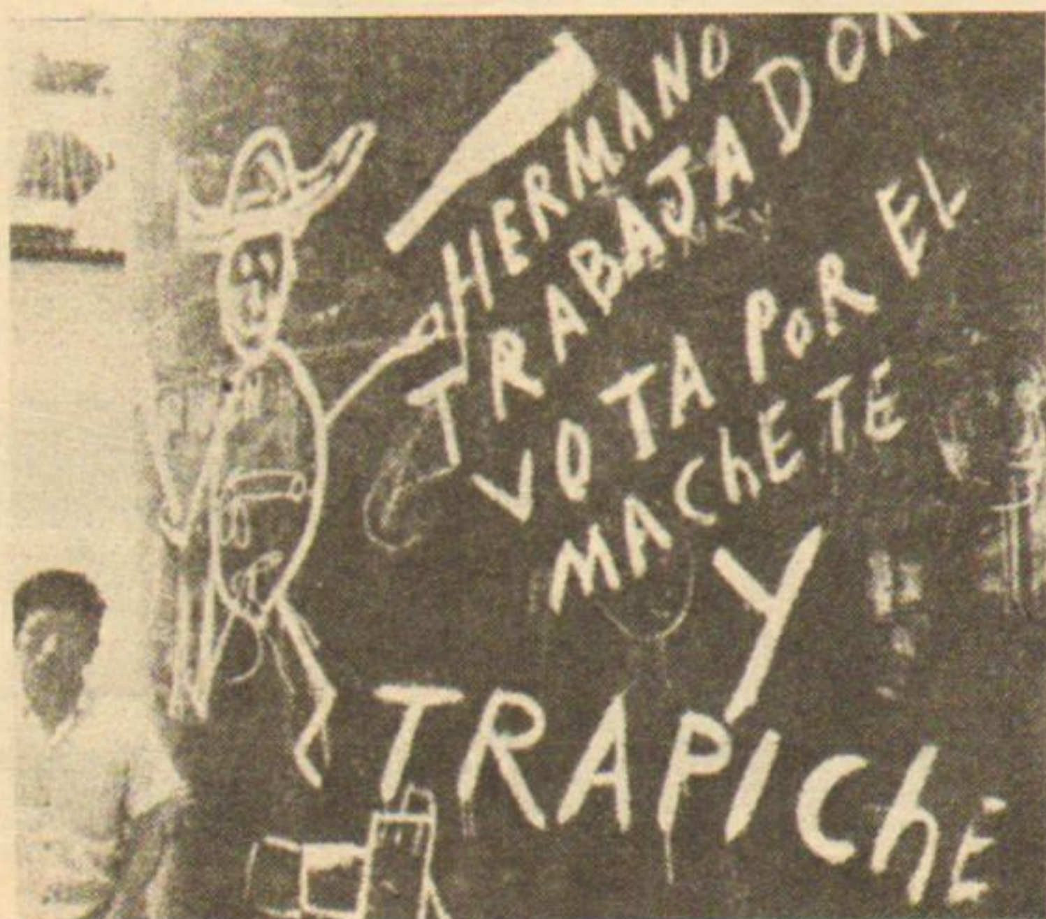
En Perú como en Argentina, las paredes reciben y transmiten el mensaje revolucionario de los pueblos.

El gobierno revolucionario de la Fuerza Armada del Perú acaba de promulgar días pasados, la ley que regula la creación y funcionamiento de las Empresas de Propiedad Social . Esta constituye uno de los peldaños más altos en la escala ascendente de la participación del pueblo peruano en la dirección de sus propios destinos, meta señalada desde los inicios de su revolución.